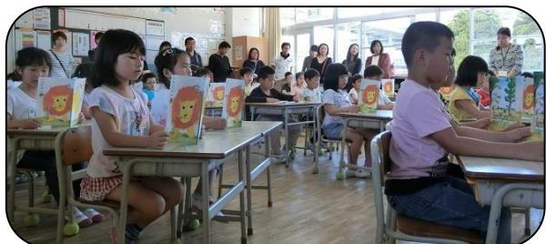
学びの基礎の「音読」、背筋が伸びています。（1年生）

◆30年度本部役員・運営委員の皆様、よろしくお祈りします！ ◆学習参観、児童も先生もがんばりました！