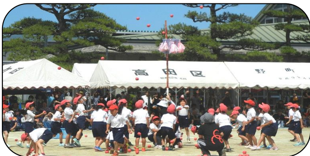
かごをめがけて力いっぱい

29日(火)に行った解団式では、6年生の団長が、「運動会で学んだことを、これからの学校生活に生かしていきましょう。」と力強いメッセージを届けてくれました。