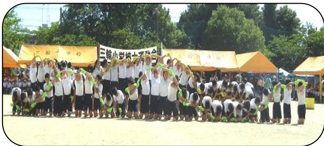
心を合わせて創る集団の美