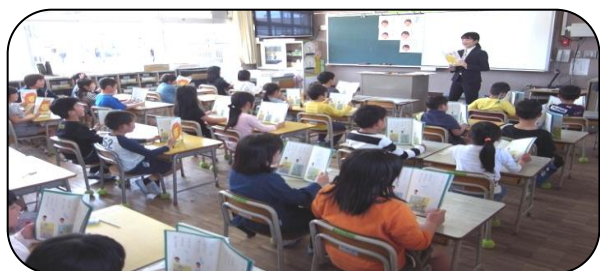
「背中はピン」で音読開始。（1年生）