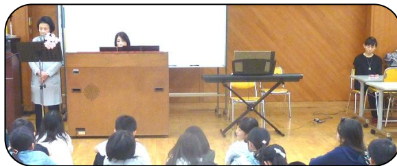
堅香子の会の方による朗読