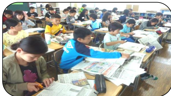
この記事を切り抜いて・・・

「新聞を読んで、記事に対する自分の意見と感想をまとめよう」をめあてに、5年生が国語の時間に新聞を広げていました。その中で、自分が気になった記事を切り抜きました。その時の子どものつぶやきが、「新聞っておもしろいね。」でした。図書室には、小学生新聞がおいてあります。ものの見方や考え方を広げる上からも、ぜひ新聞を読む習慣が身につくといいなと思っています。