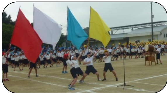
応援合戦の練習も本番さながら

当日は、子ども達のパワーに負けない、三輪小保護者による熱い応援をよろしくお願いします。