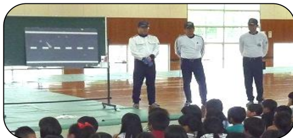
甘木自動車学校の方から交通安全について

1・2年生は正しい歩行の仕方を、3年生以上は自転車の乗り方やルールなどを教えていただきました。1年生は、さっそく生活科で、交通教室で習ったことを生かして安全に歩きながら学校の周りがあるものを見つける学習を行っていました。