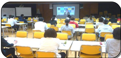
休業中に、子ども達が安心して生活できるように感染症対策の研修を行いました。

他にも、学習指導に関することや生活に関する事など、気を付けることが多々あります。心のケアも大切です。感染症拡大防止に努めながら、子ども達の学びを充実させることができよう、ご家庭でも手洗いなどの習慣化をお願いします。