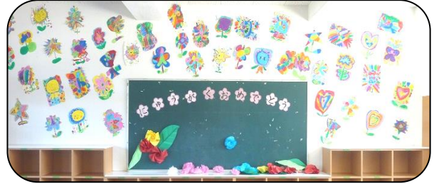
2年生の絵が、新1年生を温かく迎えてくれました。