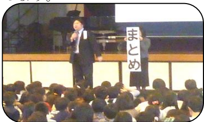
生徒指導の先生から、3学期の約束「まとめ」です。

「早寝・早起き・朝ごはん」、ネットやメディアと適切に付き合う「ネット4(し)ない宣言」(筑前町内小中学校 児童会・生徒会)を大切に、3学期も自分の可能性に向かってチャレンジしていきましょう。