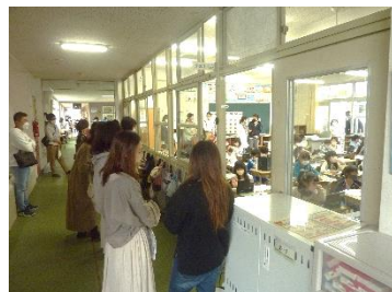
マナーを守っていただきながらの参観

本年度最初の授業参観、集会を行いました。昨年と違い教室と廊下、ベランダからのご参観となりました。学年を二つに分けての参観でしたが、保護者の方のご協力もあり比較的円滑に観ていただけたのではないかと思います。緊張しながらも子ども達の意欲満々な学習態度があったことでしょう。その後の学級集会でも待ち時間など時間幅のある中最後までのご参加があり、とても嬉しく思いました。学級の役員の皆様のご協力に感謝いたします。