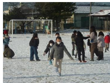
雪の魅力を感じて遊ぶ…

「強烈寒波」という言葉が前日から報道でもずいぶん取り上げられていて、かなり心配された方も多かったことでしょう。大きな被害はなかったと感じていますが、いかがだったでしょうか。子どもたちはというと都合で登校できなかった子どももいましたが、元気に歩いて登校する子どももたくさんいてとても安心しました。寒さに負けずさっそく雪遊びで元気に活動！昨年の終業式もそうでしたが、年間に数回の積雪にみんなで貴重な体験をしてみる…このことも立派な学習ですね。