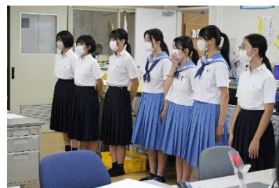
職員室でお礼と感想を伝える中学生

三輪中学校の生徒が小学校の職場体験のために来校しました。体験の二日間は各学年に2名程度入るよう計画をしていました。短い時間の中でも、小学校時代とは違った立場や視点で職場を体験することができ、それぞれの生徒なりに大きな学びを得たようでした。二日目は、職員の前でお礼を込めて感想を話してもらいました。最初の挨拶とは違って、二日間で感じたことを堂々と話している姿はとても印象的でした。