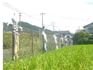
力強いがユーモラスなかかし…

田んぼの両側に、5年生が育てた稲を周りから見下ろすように16体のかかしが立っています。5年生が制作したかかしの作品です。古着やCDなどの廃材を利用して作られたかかしは何ともユーモラスな表情です。今年の夏は本当に暑い日々が続き生育に影響などあるのでしょうか？