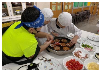
育てた野菜がおいしく変身

あじさい学級では子どもたちの企画による「ピザ&梅ジュースパーティー」が行われました。使われた野菜は子どもたちが学習で育てたものです。新鮮な野菜は上手に調理された一口ピザに大変身です。収穫の喜びをおいしいピザを食することで味わっていきます。そして、その中で1学期にがんばったことを振り返っていくのです。